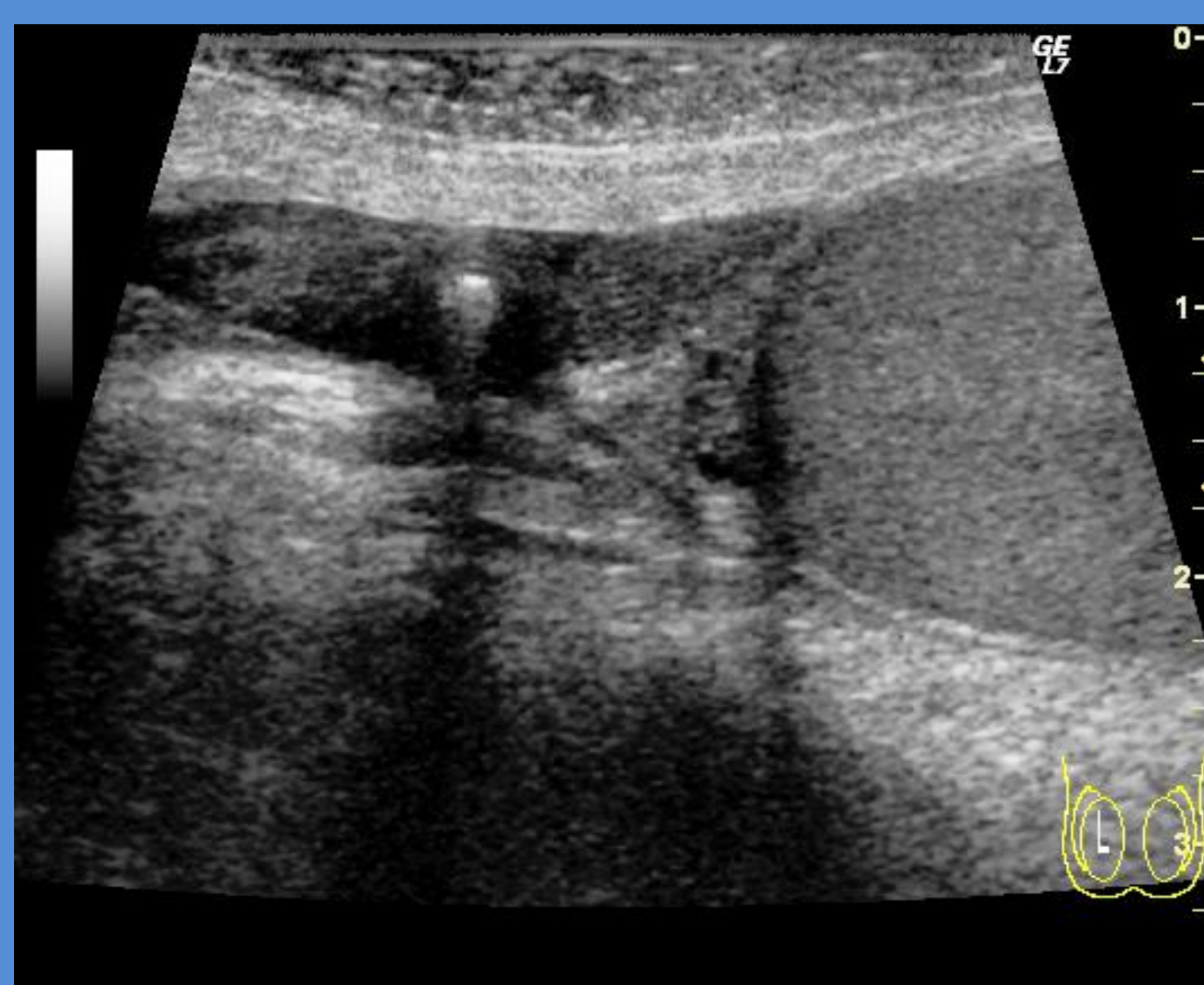
Eksempel på skrotal forkalkning (perle)